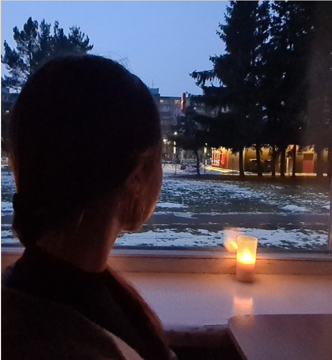
Kauno Vyturio gimnazija