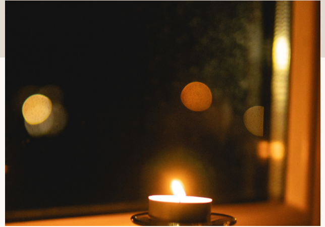
Šilutės Vydūno gimnazija