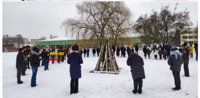
Kėdainių „Aušros“ progimnazija