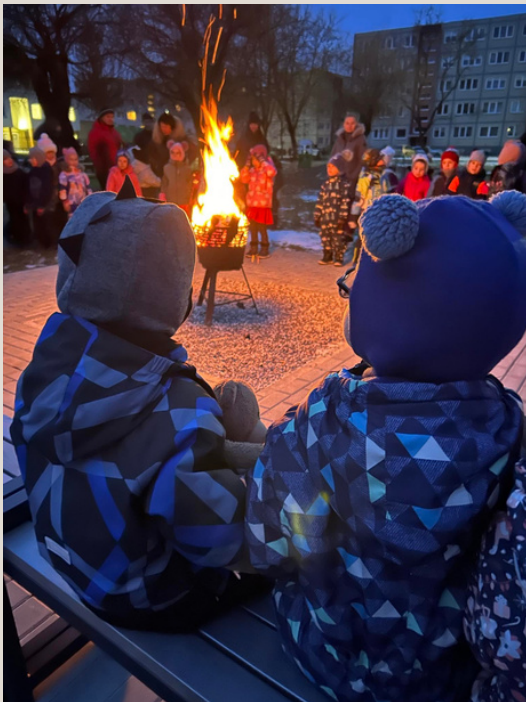
Kėdainių lopšelis-darželis „Vaikystė“

Minint prieš trisdešimt trejus metus iškovotą pilietinę pergalę prieš agresorių, 2024 m. sausio 12 d. 8 val. ryto visoje Lietuvoje, languose, dešimčiai minučių buvo uždegtos vienybės, atminties ir pergalės žvakutės.