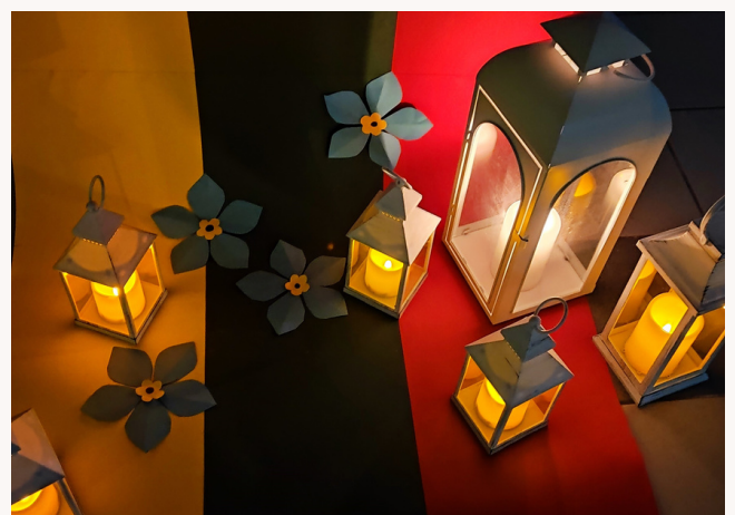
Anykščių A. Baranausko pagrindinė mokykla